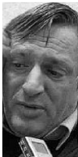
Don Luigi Ciotti

Nella giunta regionale sarà definitivamente approvato un protocollo d'intesa tra la Regione Lazio e l'ufficio del Commissario straordinario di Governo per la gestione e la destinazione dei beni confiscati alle organizzazioni criminali.