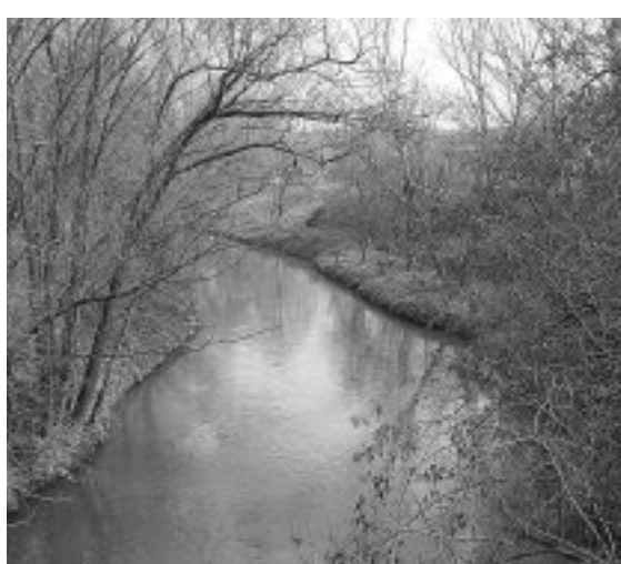
Un tratto dell'inquinatissimo fiume Sacco

Come Coldiretti stiamo procedendo al lavoro relativo al censimento delle imprese colpite che iniziato nei mesi